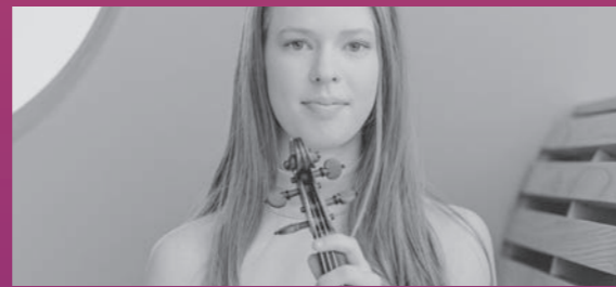
Hawijch Elders viool