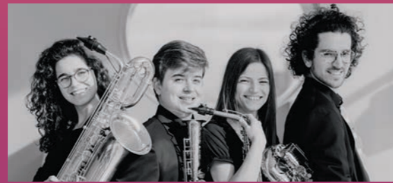
Maat Saxophone Quartet